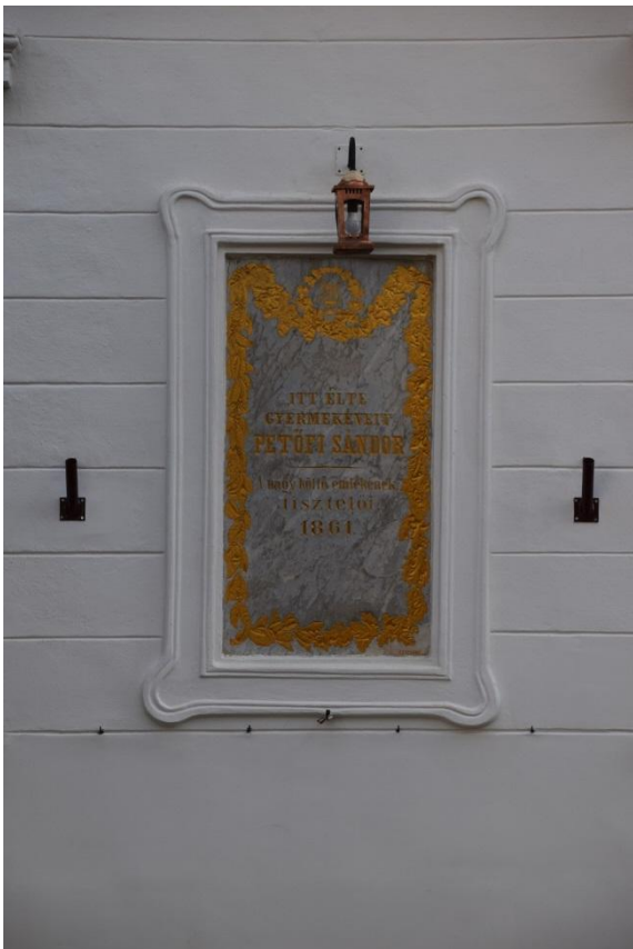
Emléktábla– felújítás után