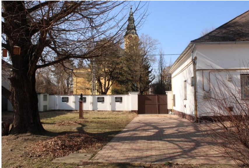
Petőfi Sándor Emlékház udvara a megújítás előtt