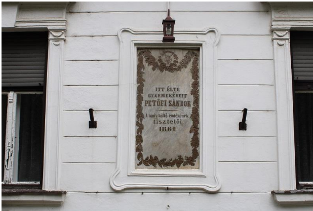
Emléktábla a kiskunfélegyházi Petőfi Sándor Emlékház homlokzatán – felújítás előtt Az emléktábla 1861-ben készült, felavatása 1867. október 13-án volt.