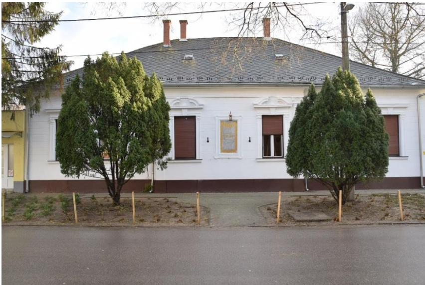
Petőfi Sándor Emlékház – utcafront a felújítás után