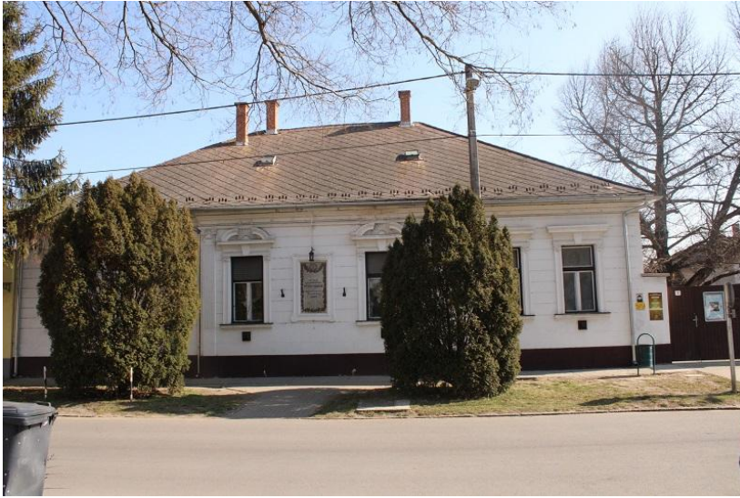
Petőfi Sándor Emlékház – utcafront a felújítás előtt (Kiskunfélegyháza, Petőfi Sándor u. 7.)