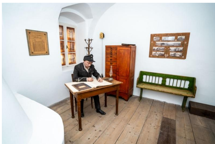
Részlet a kiállításból- börtönőr szobája