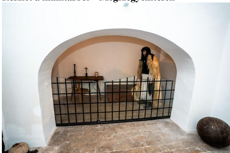
Részlet a kiállításból – fogva tartás