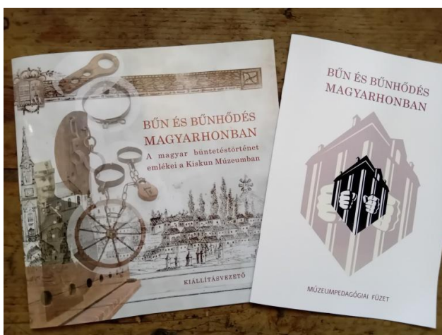
Kiadványok: kiállítás-vezető, múzeumpedagógiai füzet