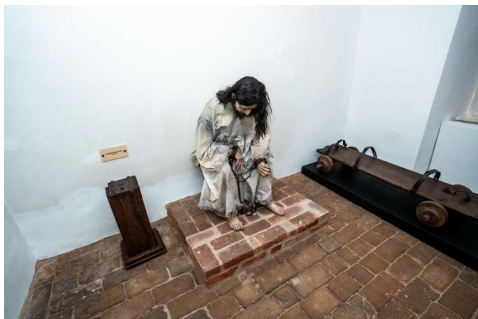
Részlet a kiállításból – kivégzések

A magyar büntetéstörténet emlékei a XVI - XIX. században A Kiskun Múzeum állandó kiállítása