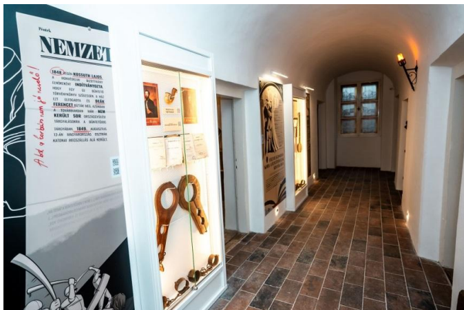
Részlet a kiállításból – földszint folyosó

A magyar büntetéstörténet emlékei a XVI - XIX. században A Kiskun Múzeum állandó kiállítása