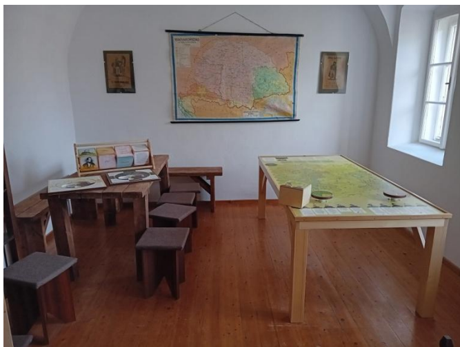
Interaktív játékok és óriás társasjáték

A magyar büntetéstörténet emlékei a XVI - XIX. században A Kiskun Múzeum állandó kiállítása