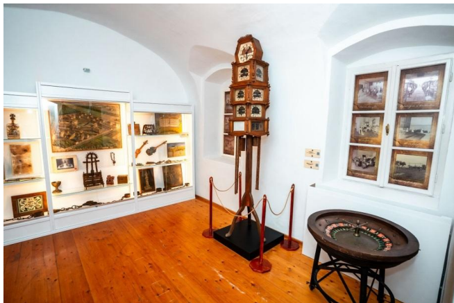
Részlet a kiállításból – rabmunkák terme

A magyar büntetéstörténet emlékei a XVI - XIX. században A Kiskun Múzeum állandó kiállítása