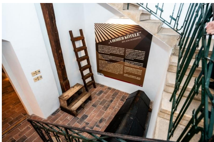
Részlet a kiállításból – lépcsőház