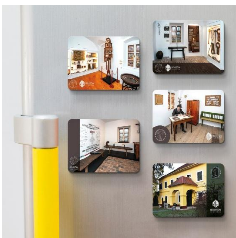
Ajándéktárgyak - hűtő mágnes