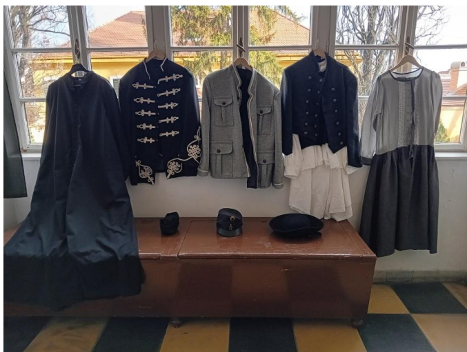
Ruhák az interaktív tárlatvezetésekhez