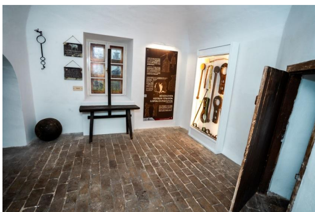
Részlet a kiállításból – Megszégyenítések