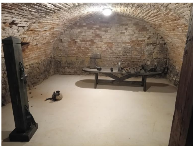
Felújított pince a műtárgymásolatokkal