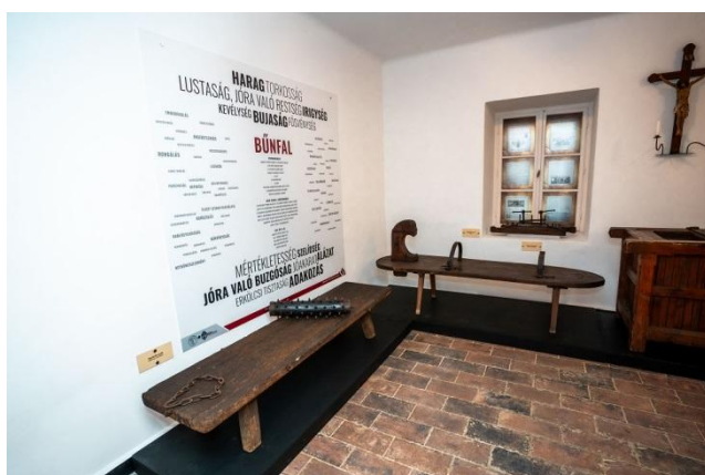
Részlet a kiállításból - Bűnfal