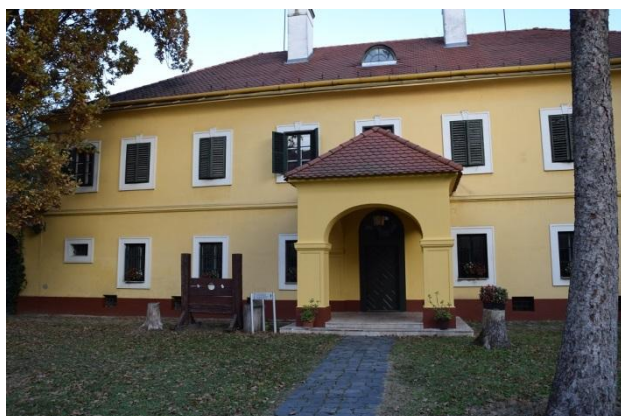
Az épület bejárata

A megújult büntetéstörténeti kiállítás képei: