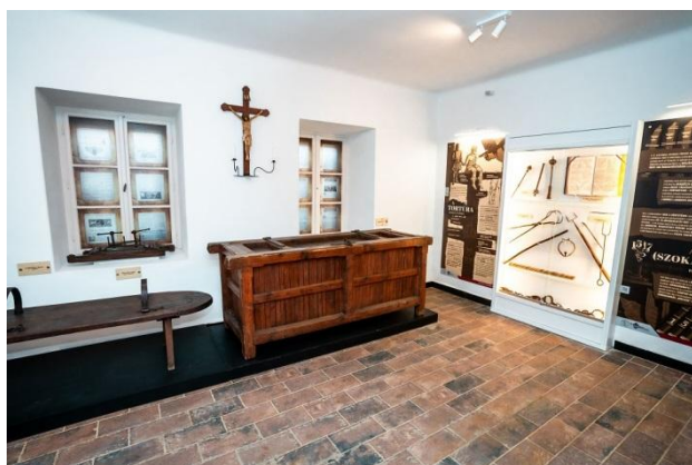
Részlet a kiállításból – Vallatások